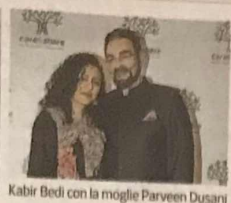
Kabir Bedi con la moglie Parveen Dusanj