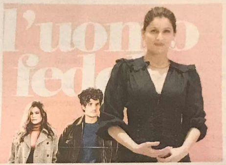
Attrice Laetitia Casta, a Roma per il festival sul nuovo cinema francese